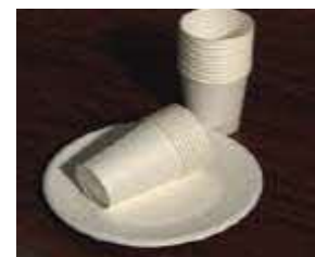
防水加工された紙