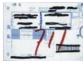
(宅配便の伝票など)