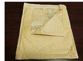
(通販用緩衝封筒など)