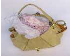
カバンや靴などの詰物