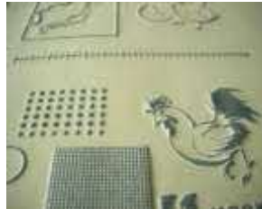
感熱性発泡紙 (立体コピー紙)