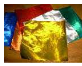
(金銀の折り紙など)