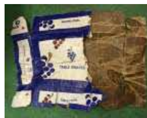
ろう(蠟)段 (ワックス付段ボール)