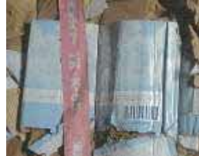
(石鹸や柔軟剤の包装箱)