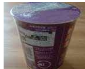
(紙コップ、紙皿、紙製のカップ麺容器など)

B 類の「古紙に混入することは好ましくないもの」の中には、製紙原料などとして利用できるようになってきているものがありますので、地域の古紙問屋又は古紙回収業者にご確認ください。