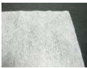
(マスク、簡易お手拭、 包装紙など)