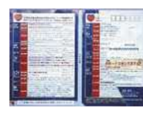
(公共料金の請求書)