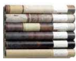
(壁紙、防水シートなど)