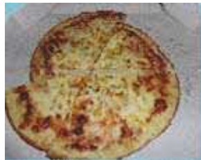
食品残渣のついた紙