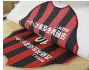
(アイロンプリント紙)