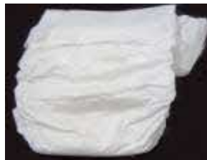
(紙おむつ、生理用品、 ペット用トイレシート)