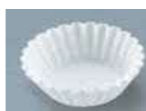
(クッキングシートなど)