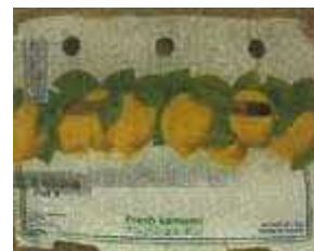
(輸入青果物・水産加工品を入れる段ボール箱)