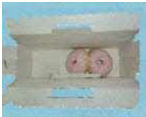
(ピザ、ケーキなどの食品を直接包装した容器)