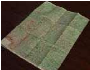
(地図、選挙ポスター)