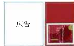
(サンプルが付いたままの 新聞折込チラシ、雑誌)