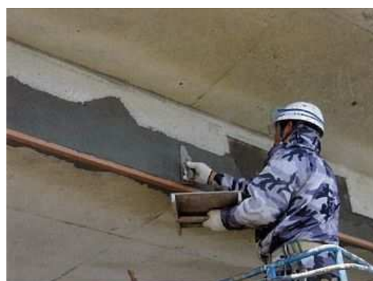
写真4-3 断面修復状況