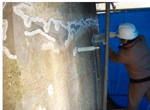
写真4-2 ひび割れ注入状況

ひび割れを塞ぐことにより、劣化因子（水分、塩化物など）の侵入を防止し、コンクリートの耐久性を向上することができます。