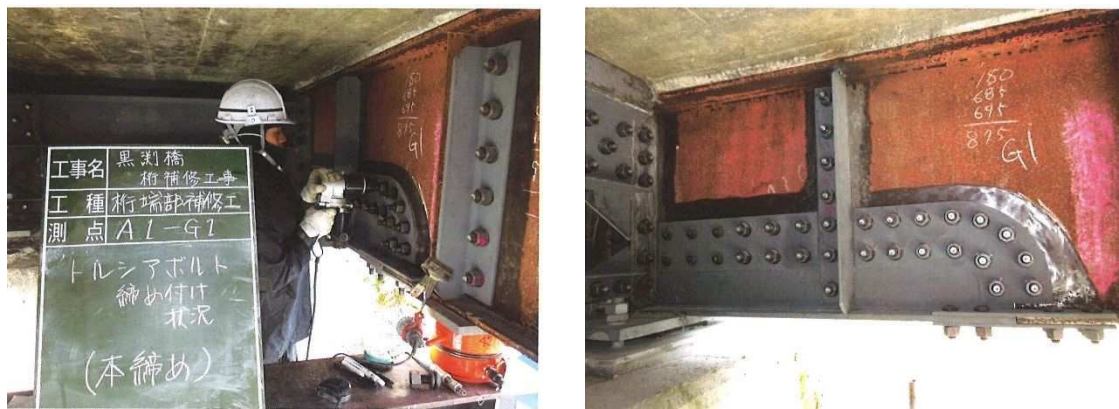
写真4-1 当て板工実施状況

激しい腐食による鋼部材の減厚が生じた箇所に対し、腐食箇所を取り囲むようにあて板（添接版）を施すことにより鋼部材を補修する工法です。