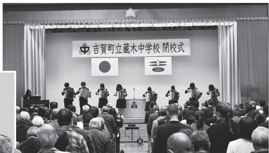
吉賀町立蔵木中学校の閉校式