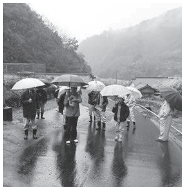
栗木谷川の現地調査

昭和47年の豪雨災害後、砂防堰堤が完成したが、豪雨災害時の山地崩壊跡があり今後崩壊の恐れがあるため