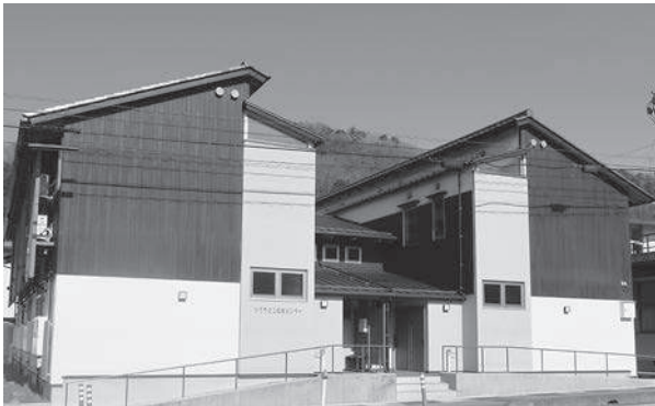
サクラマス交流センター

2万円×12カ月×4人で96万円を予算計上。下宿先については、実際の入学生の動向は流動的なところがあり、わからない。