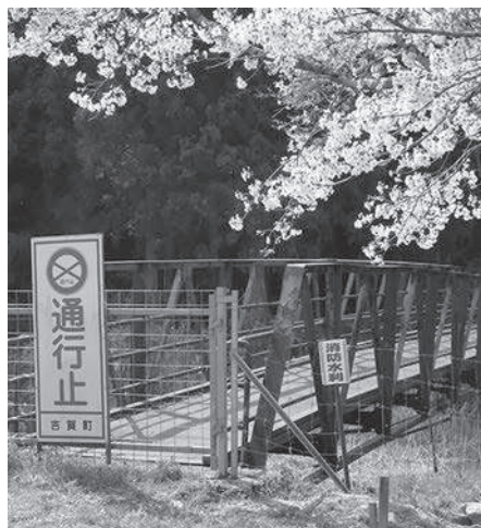
柿木村木部谷の台橋