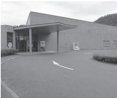
むいかいち温泉ゆ・ら・ら