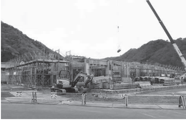
建設中の障がい者総合支援センター