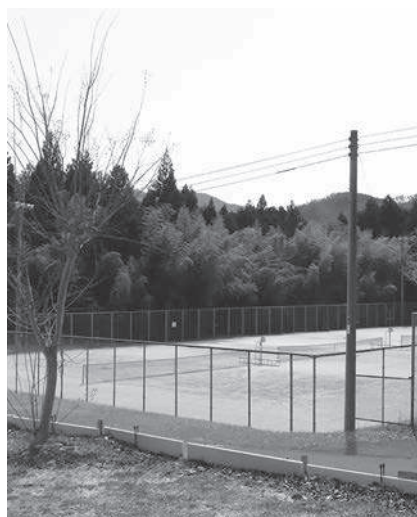
スポーツ公園テニスコート