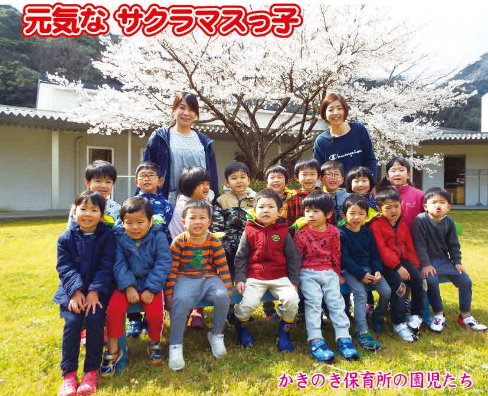
かきのき保育所の園児たち