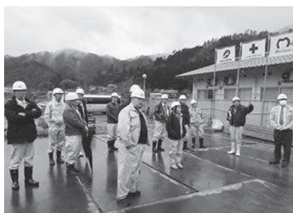
障がい者総合支援センターの工事現場