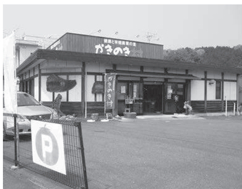
廿日市のアンテナショップ