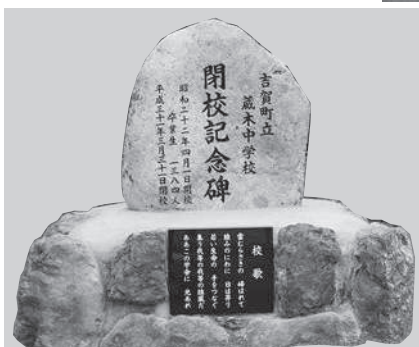
蔵木中学校の閉校記念碑